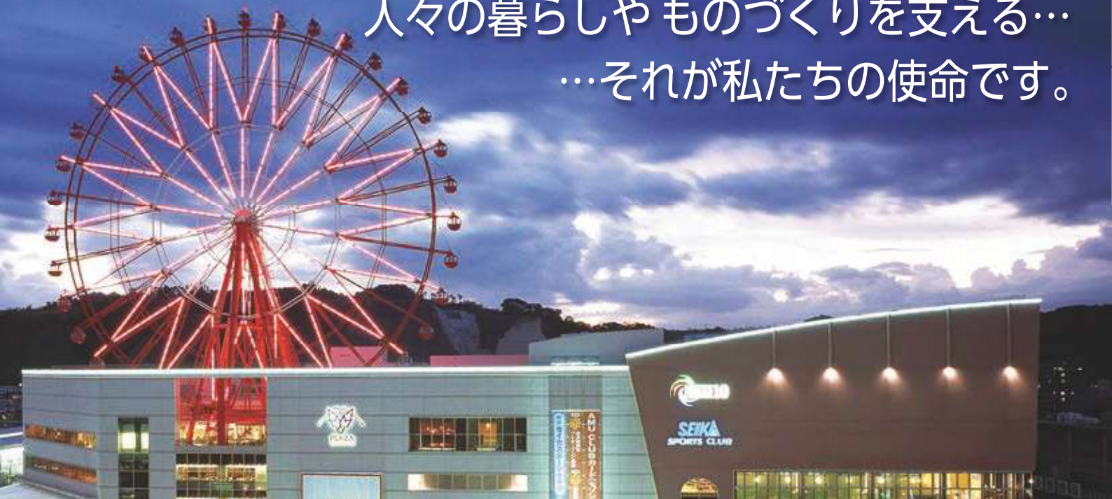
アミュラン（鹿児島中央駅屋上観覧車）