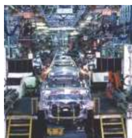
自動車メーカー製造ライン