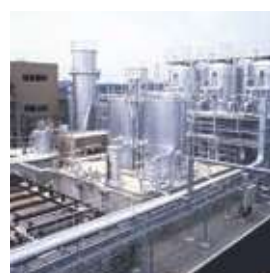
衛生プラント設備