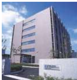
理化学研究所 神戸事業所