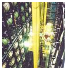
ウイスキー長期貯蔵自動倉庫