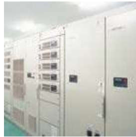
熱延工場動力制御盤