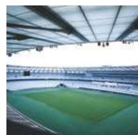
味の素スタジアム