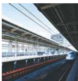
新大阪駅 27番線ホーム