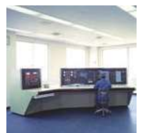
下水処理 中央監視盤