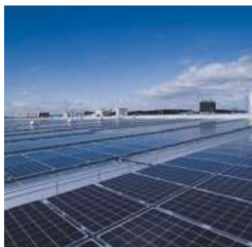
屋根置き式ソーラー（兵庫）