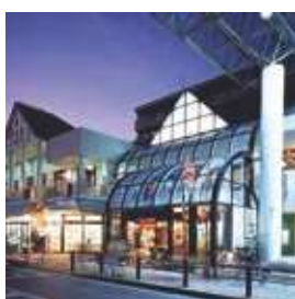
ロビーシティ相模大野5番街