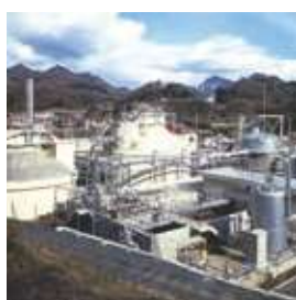
バイオガス発生装置