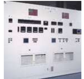
医薬品製造監視盤