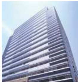
大阪市中央卸売市場