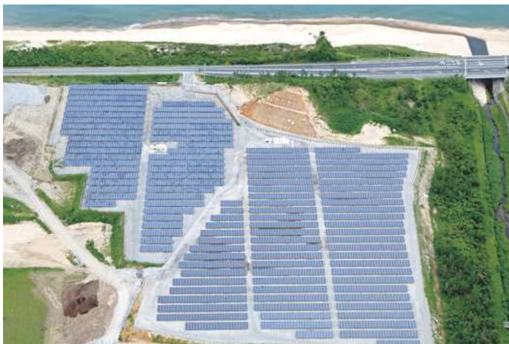
当社メガソーラー（鳥取）