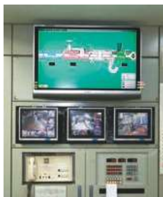
拡張システム（遠隔監視システム・緊急通報システム）