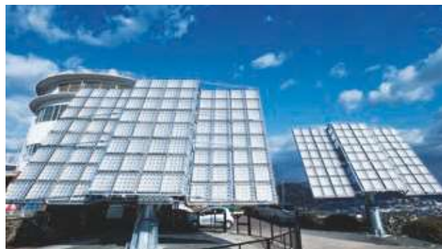
追尾型集光式 太陽光発電システム（岡山）