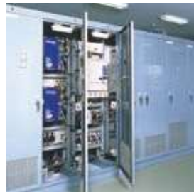
インバーター制御盤