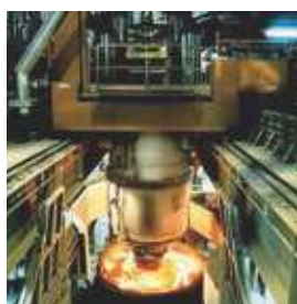
鉄鋼メーカー RH 炉