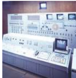
火力発電所揚炭搬送 中央監視盤