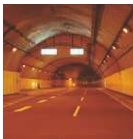
阪神高速 32号新神戸トンネル