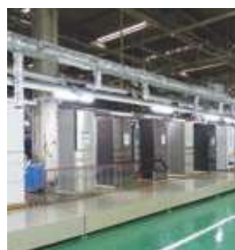
冷蔵庫製造ライン