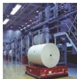
巻き取り紙無人搬送システム