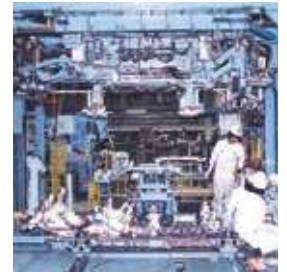
自動車メーカー 北米工場