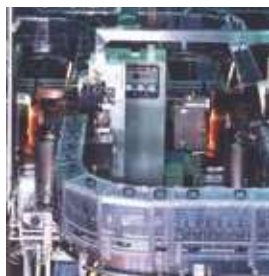
ビール空ビン検査機