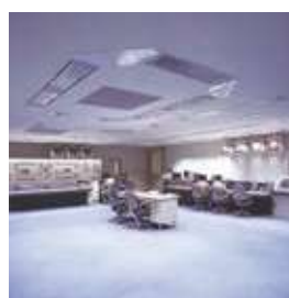
ゴミ処理場 中央監視盤