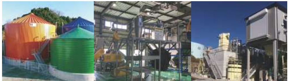
牧之原バイオガス発電所（静岡）