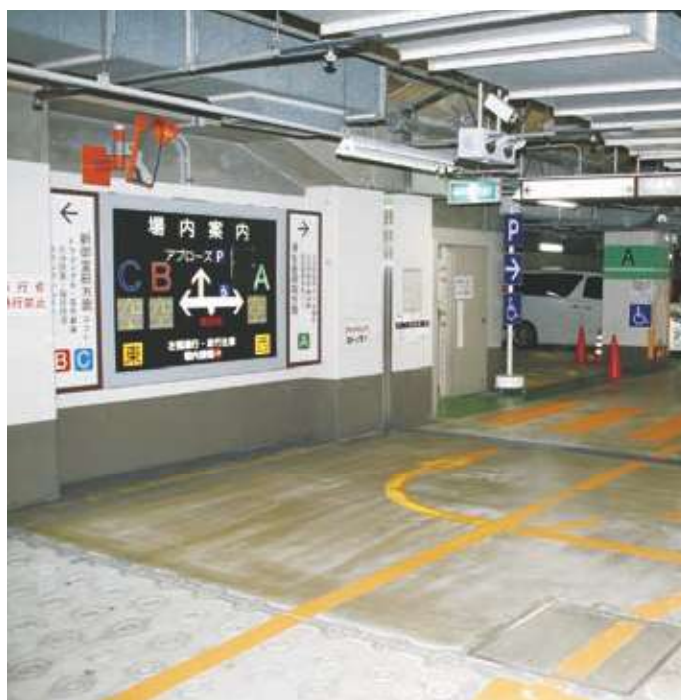
駐車場管制設備（料金精算システム・車路管制システム）

当社は、駐車場・駐輪場における必要なすべてのこと「人・物（設備）・ノウハウ」を提供するトータルパーキングコーディネーターであり、お客様の良きパートナーでありたいと考えています。