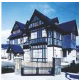
重要文化財 旧門司三井倶楽部