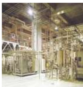
ジュース生産設備