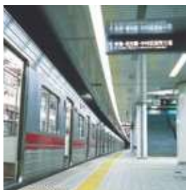
名古屋市営地下鉄桜通線 野並駅